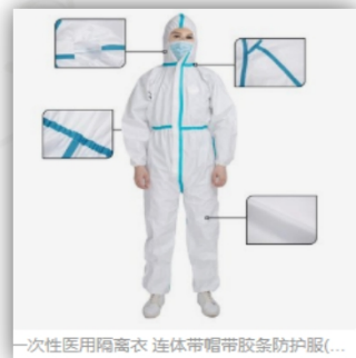
一次性医用隔离衣 连体带帽带胶条防护服(...)

医务人员进入缓冲病区时根据《医疗机构内新型冠状病毒感染预防与控制技术指南（第一版）》（国卫办医函〔2020〕65号）中医务人员防护的相关内容，采取相应防护措施